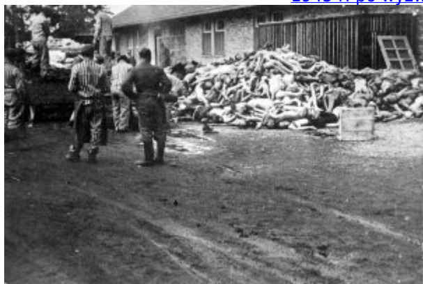
KL Dachau - więźniowie rozładują z platformy ciała pomordowanych, na drugim planie budynek krematorium; 1945 r.