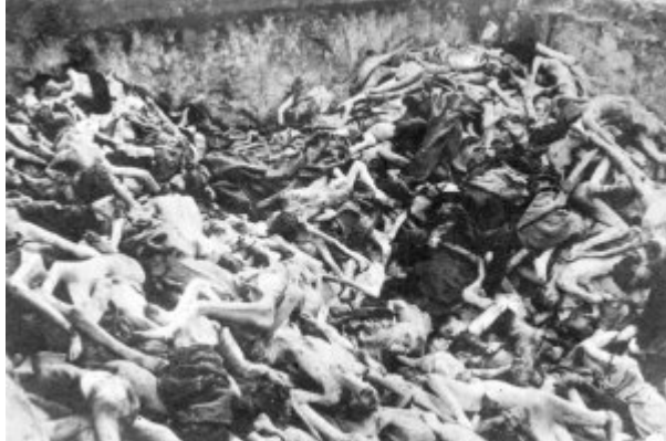
KL Bergen-Belsen – wspólna mogiła pomordowanych więźniów; kwiecień 1945 r. po wyzwoleniu obozu.