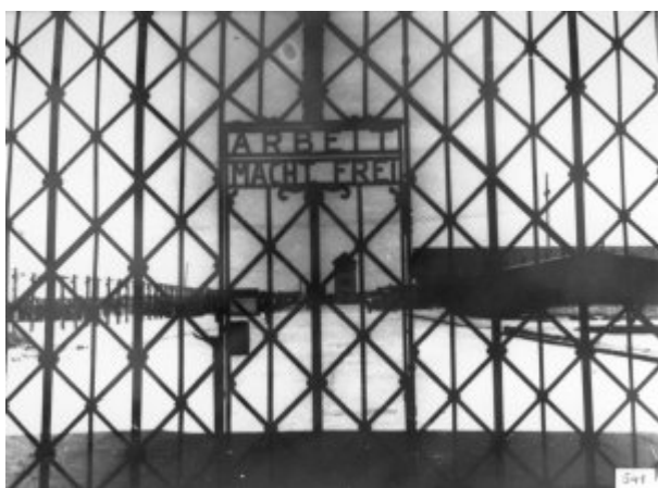
Brama obozowa KL Dachau z napisem „Arbeit macht frei” (Praca czyni wolnym).

W Ravensbrück na więźniarkach, głównie młodych Polkach, przeprowadzano doświadczenia pseudomedyczne polegające na wycinaniu części kości nóg.