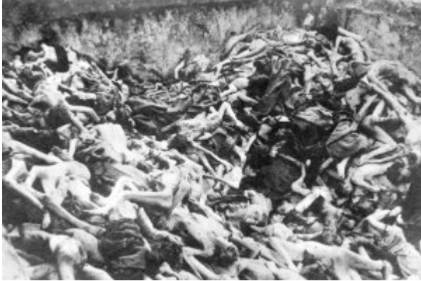
KL Bergen-Belsen – wspólna mogiła pomordowanych więźniów; kwiecień 1945 r. po wyzwoleniu obozu.