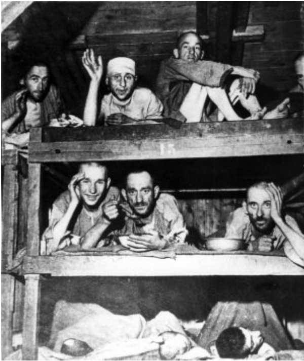
KL Buchenwald - byli więźniowie na pryzkach obozowych; kwiecień 1945 r. po wyzwoleniu obozu.